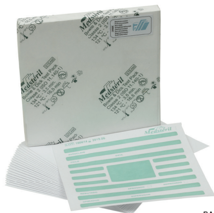
PACOTE TESTE PRONTO

Sua utilização confere segurança e padrão de excelência à CME.